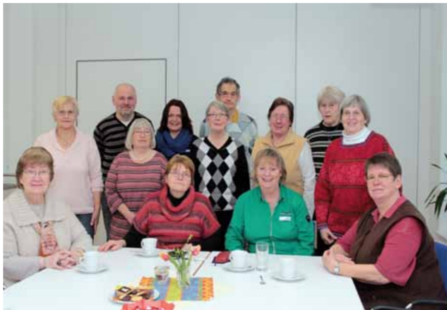
Raum für Ideen und ein offenes Ohr für alle bei der monatlichen Mitarbeiter-Montagsrunde